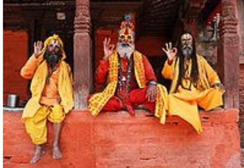
Tre hinduiska asketer gör mudra

Den färgade prick som hinduer, särskilt kvinnor, har i pannan kallas tilaka , bottu , bindiya , bindi eller kumkum . Pricken signalerar att personen ifråga är hindu. Pricken symboliserar också det tredje ögat , det öga som ser inåt, mot Gud. Idag (2008) är det mindre vanligt att män har denna prick. Ogifta kvinnor brukar bära en svart prick, medan gifta kvinnor har ett rött streck ( sindoor ) ristat vid hårbotten.